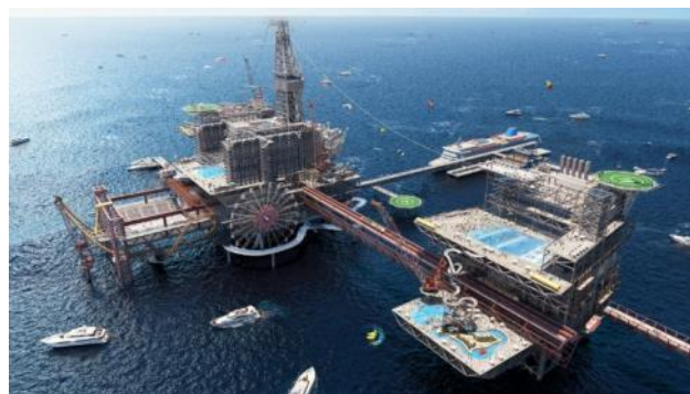
Slika 2. Projekat „The Rig“, Saudijska Arabija

Prvi projekat prenamene napuštene naftne platforme koji je prikazan široj javnosti i koji je dobio pozitivne komentare, dolazi iz Saudijske Arabije (slika 2) što nije začuđujuće s obzirom da je privreda ove države bazirana upravo na nafti, njenoj eksploataciji i prodaji.