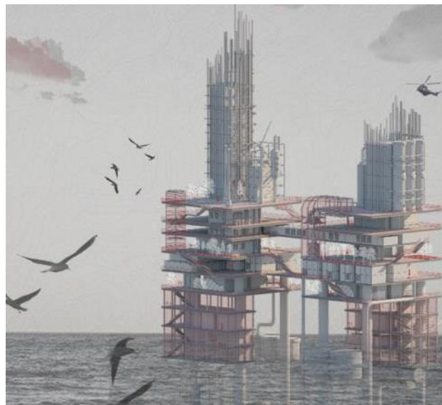
Slika 4. Izometrijski prikaz novoprojektovane strukture

Arhitektura novoprojektovane strukture inspirisana je haj-tek stilskim pravcem u savremenoj arhitekturi. Upotreba pravih i oštih linija, stakla, betona i metala, kao i izvođenje instalacija na fasadu, u potpunosti pristaju ovoj transformaciji i adaptaciji naftne platforme. Na slici