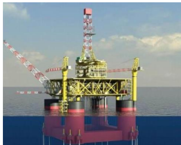
Slika 1. Primer naftne platforme

Naftna platforma, obalna platforma ili obalna bušilica je velika građevina sa mogućnostima bušenja bušotina za istraživanje, vađenje, skladištenje i preradu nafte i prirodnog plina koja se nalazi u stenama ispod morskog dna. U mnogim slučajevima platforma sadrži opremu za smeštaj radne snage. Naftne platforme najčešće učestvuju u aktivnostima na kontinentalnom pojasu, mada se takođe mogu koristiti u jezerima, obalnim vodama i unutrašnjim morima. Zavisno od okolnosti, platforma može biti