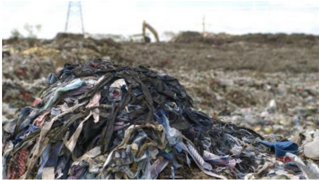
Slika 3. Deponija stare odeće

Veoma je važno pronaći efikasna rešenja u najkraćem mogućem roku kako bi se modna industrija reorganizovala i postavila na kolosek proizvodnje koji bi bio održiviji i pogodniji za životnu sredinu i koji ne bi uticao na klimatske promene. Od modnih brendova se očekuje da postanu odgovorni za ono što se dešava u njihovim lancima snabdevanja i da preduzimaju punu odgovornost za ono što se dešava sa njihovom odećom na kraju tog lanca.