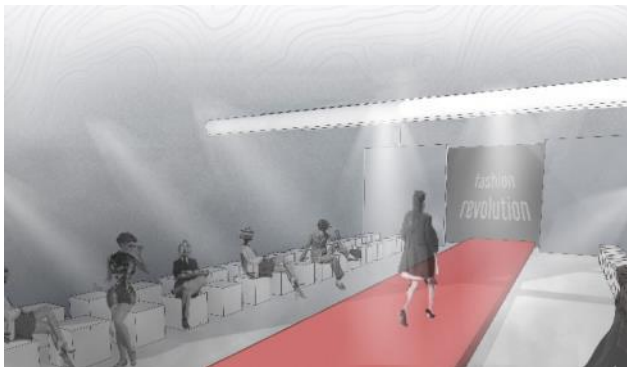
Slika 5. Ambijentalni prikaz modne piste

4 se može videti novoprojektovano stanje platforme. Glavni sadržaj je reciklaža i stvaranje novih odevnih predmeta, a u sklopu objekta postoje i galerijski prostori gde bi se mogli videti kompletni procesi transformacije elementa od otpada do nove garderobe, a planirana je i modna pista na kojoj bi se održavale revije dobijenih komada odeće (slika 5). Glavni prostori pored ovih jesu javne površine, odnosno mali trgovi koji se prostiru čitavom strukturom i služe za okupljanje i druženje korisnika.