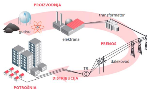
Slika 1. Prikaz toka energije u EES