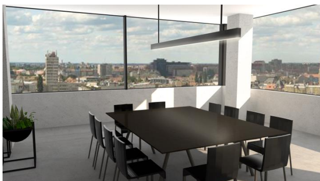
Slika 4. Prikaz enterijera konferencijske sale