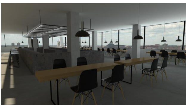
Slika 5. Prikaz enterijera restorana