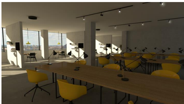
Slika 2. Prikaz enterijera coworking prostora

U delu za zajednički rad, stolovi su custom made pravougaonog oblika, dimenzija ŠxVxD=150x75x65cm. Materijal koji je za ploču stola korišćen je hrast, a za noge čelik crne boje. Stolice su žute boje sa aluminijumskim crnim nogama.