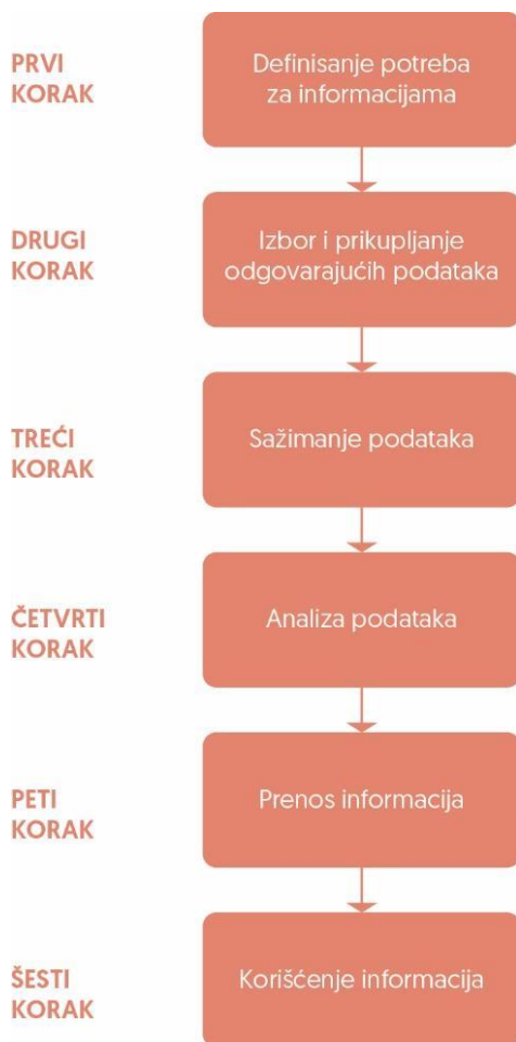
Slika 8.1. Osnovni koraci u razvoju i radu sistema [2]

Informacioni sistemi treba da pruže podršku prvenstveno menadžerima, jer su oni odgovorni za vođenje organizacije na putu do postizanja ciljeva. Da bi se informacioni sistem uspostavio, da bi radio i razvijao se, potrebno je preduzeti šest osnovnih koraka koji su prikazani na slici 8.1.