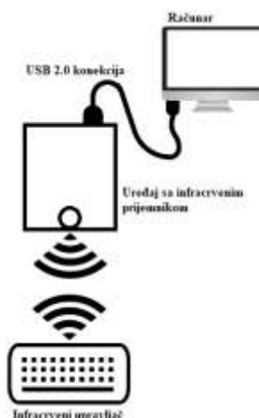
Slika 1. Konceptualni prikaz opisanog uređaja

Ovaj rad proistekao je iz master rada čiji mentor je bio dr Vladimir Rajs, docent.