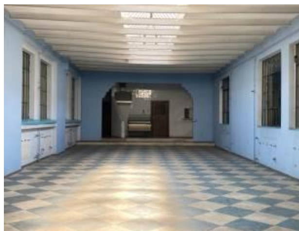
Slika 2. Fotografija mesta za izvođenje

postanu. Prepoznavanje i građenje efemernih svetova sa upečatljivom atmosferom i semantikom, vidim kao izazov i nepresušni istraživački zadatak.