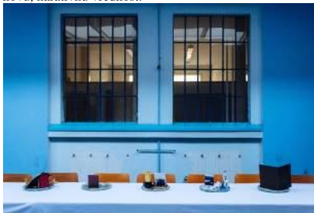
Slika 3. Fotografija postavke

Sam početak produkcije rada „Večera“ ne mogu da lociram u vremenu, kad to kažem, mislim na nesvesno skupljanje predmeta i simbola, to traje godinama, u neznanju za šta će biti upotrebljeni i koji kontekst ispuniti. Pored emotivne i dekorativne vrednosti koju za mene ti objekti predstavljaju u toku ovog rada i kombinacije sa ostalim sredstvima (čulima), oni dobijaju novu, narativnu vrednost.