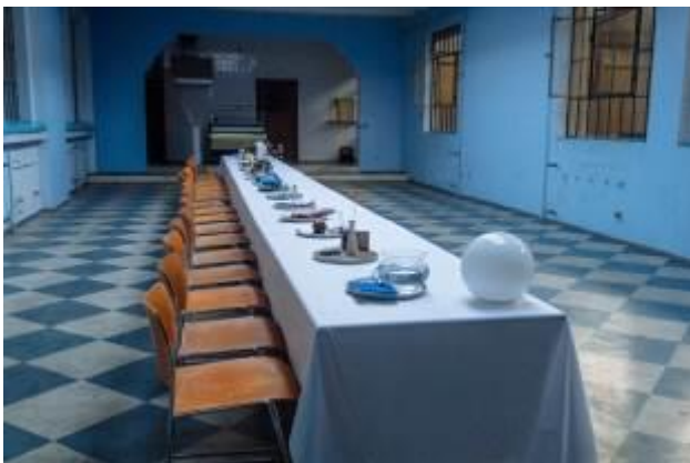
Slika 4. Fotografija postavke

Sinhrono razvijanje elemenata su, zapravo, produkcionni deo ovog rada, gde jedan segment vuče drugi i tako formira realizaciju. Timskim radom i razmenom ovaj scenski doživljaj gradi punoću i novo iskustvo.