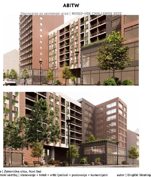
Slika 3. – novoprojektovani kompleks

Na ovoj etaži uvedene su nove terase, sa ulične i dvorišne strane. Zbog forme objekta koja je stepenasta, i gde je svaki deo objekta različite visine, od drugog do sedmog sprata je tipska osnova svih prostornih celina. Na osmoj etaži prestaje stanovanje, a na devetoj poslovanje. Osnova hotelskog prostora nastavlja se do trinaestog nivoa, koji predstavlja najvišu tačku objekta.