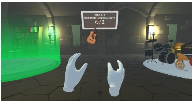
Slika 10. Primer prebacivanja instrumenta sa gomile u označeno polje

Tokom ovog nivoa korisnik se ne kreće već stoji ispred dva polja prikazanih na slici 10. Korisniku se pušta melodija, a on zatim na osnovu toga koje je instrumente prepoznao u toj melodiji prebacuje njihove fizičke verzije sa gomile instrumenta koja se nalaze sa desne strane u polje sa leve strane.