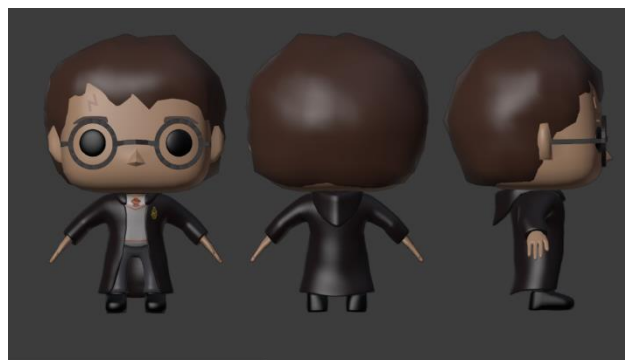
Slika 4. Prikaz modela Harija Potera modelovanog po ugledu na funky pop figurice u low poly stilu

Za ulogu mentora je izabran lik Harija Potera (Slika 4) pošto je on poznat među mlađim igračima, a i potiče iz svet u koji je igra smeštena.