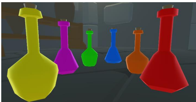
Slika 6. Prikaz svake od bočica sa napitkom različite boje

U sobi se nalaze stolovi sa napicima u boji, svaki sa progresivno težim izazovima. Boje u kojima dolaze napici su crvena, zelena, plava, žuta, ljubičasta i narandžasta (Slika 6).