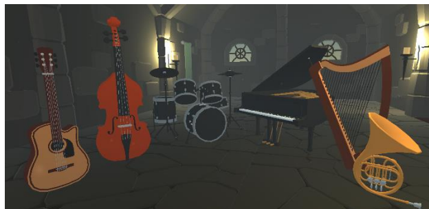
Slika 9. Prikaz modela svih instrumenata

Pored mehanike hvatanja igrač mora da prepozna koji od instrumenata čini melodiju koja se čuje u tom krugu. Melodija se sastoji od tačno šest instrumenata koje čine: gitara, bas gitara, bubnjevi, klavir, harfa i truba (Slika 9).