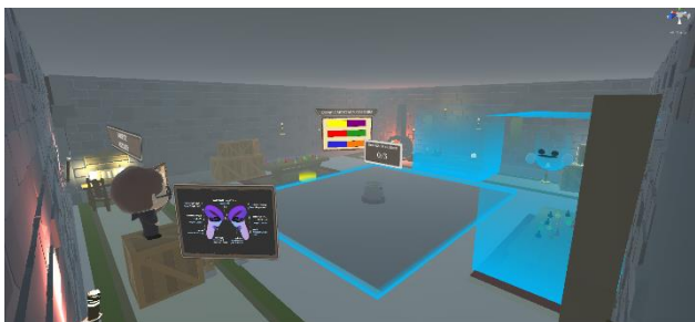
Slika 5. Prikaz prvog nivoa igre

Cilj prvog nivoa je da se nauče komplementarne boje tj. boje koje se nalaze na suprotnim stranama spektra boja. Izgled prvog nivoa prikazan je na slici 5.