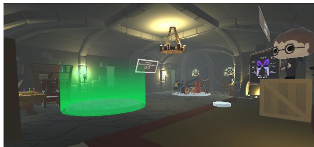
Slika 8. Prikaz izgleda drugog nivoa

Cilj drugog nivoa je da se nauče instrumenti. Ovaj nivo se kako po izgledu tako i po tematici i zagonetkama drastično razlikuje od prethodnog nivoa (Slika 8). To je urađeno sa ciljem kako bi igrač napravio jasnu razliku između nivoa i kako bi se sa promenom prostora igrač iznova zainteresovao i motivisao za dalji napredak. Na drugom nivou je cilj da se igrač nauče prepoznavanju zvukova različitih instrumenata.