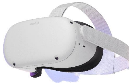
Slika 1. Prikaz uređaja Oculus Quest 2

Uređaja koji je odabran da se za njega razvija video igra je najnoviji član Quest serije, pod nazivom Oculus Quest 2 (od kraja 2021. godine poznat i kao Meta Quest 2 ) (Slika 1).