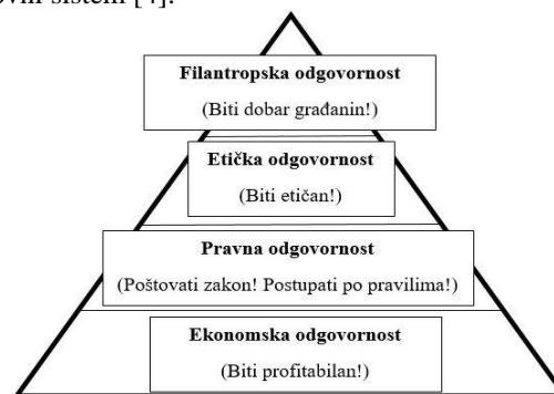
Slika 2. Piramida društvene odgovornosti

U okviru ovog modela Carroll integriše četiri predložena aspekta KDO u obliku piramide, gde osnovu čine ekonomske odgovornosti, a svi drugi nivoi odgovornosti: pravna, etička i filantropska se zaničaju na njemu. Prema njegovom mišljenju ekonomska odgovornost se smatra primarnim, i predstavlja preduslov za ostale odgovornosti, jer se samo na stabilnim ekonomskim osnovama može izgraditi KDO infrastruktura, kao i snažan, održiv poslovni sistem [4].