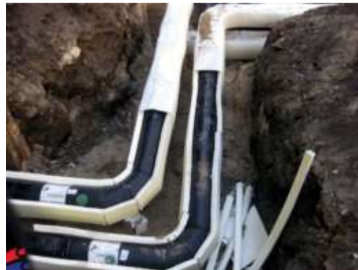
Slika 1. Kompenzacioni jastuci

Kompenzacioni jastuci (slika 1.) su najviše našli primenu kod vrelovoda u grejnoj tehnici, dok se u naftnoj industriji manje koriste. Postavljanjem obloge od mekanog materijala oko cevovoda smanjuje se otpor zemlje ekspanziji cevovoda.