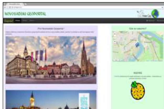
Slika 5. Početna stranica Geoportala

Izgled početne stranice Geoportala je prikazana na slici 5.