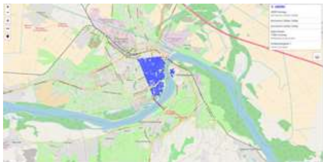
Slika 2. Vizuelizacija podataka na Leaflet mapi

Leaflet je vodeća JavaScript biblioteka za interaktivne mape prilagođene mobilnim uređajima i računarima. Na Leaflet mapi su učitani vektorski podaci preuzeti sa Geoportala Srbije (slika 2). Dodate su odgovarajuće funkcionalnosti poput pretrage, merenja na mapi, mogućnosti isključivanja i uključivanja slojeva prikazanih na mapi i određivanja lokacije uređaja preko kog je pristupljeno mapi.