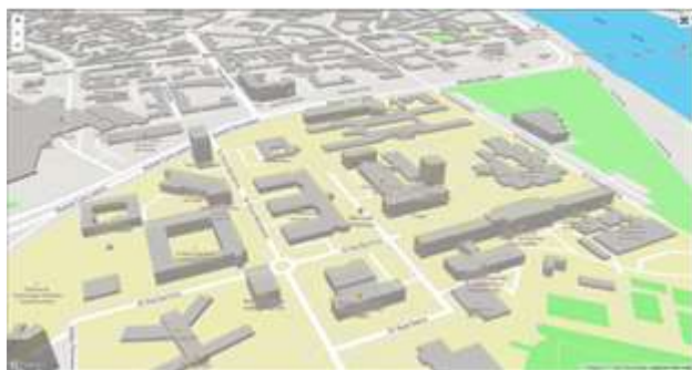
Slika 3. Vizuelizacija 3D gradova

MapBox je JavaScript biblioteka koja koristi WebGL (engl. Web Graphics Library ) standard za renderovanje interaktivnih mapa. Iskorišćena je za 3D vizuelizaciju gradova (slika 3). Podatak o visini objekata je preuzet sa OpenLayersMap-a .