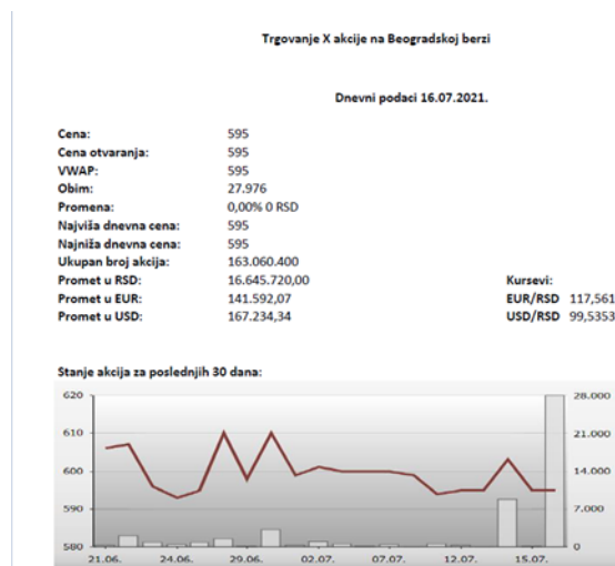
Slika 3. PDF izveštaj izgenerisan od strane robota

Pravci daljeg istraživanja mogu da obuhvate temu jasnog definisanja metodološkog postupka određivanja pogodnih procesa za robotizaciju, kao i primenu veštačke inteligencije i drugih naprednih mogućnosti nad robotskom automatizacijom kompleksnijeg poslovnog procesa.