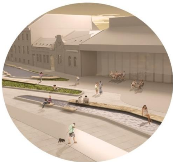
Slika 1. Prikaz transformacije venca

Cilj je prikazati odraz jednog ovakvog projekta i njegov uticaj u ekonomskom, kulturnom i socijalnom kontekstu. S obzirom na to da celi proces, od njegovog nastanka pa do ponovne upotrebe, predstavlja ne samointeressant urbanu dizajn u smislu fizičke strukture, već projekat čiji se odraz vidi u mnogim segmentima grada.