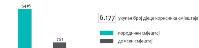
Графикон бр.3: Број дјеце који користи услуге домског или породичног смјештаја [6]

Услуге домског или породичног смјештаја у систему социјалне заштите користило је укупно 6.177 дјеце, што се види на графикону бр.3.