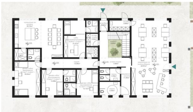
Илустрација бр. 1: Приказ стамбене јединице