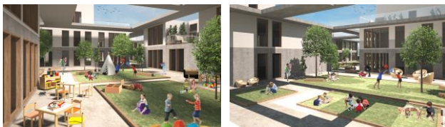
Илустрација бр. 2 и 3: Приказ заједничких отворених простора

Организацијом стамбених јединица у различитим дијеловима парцеле, настале су различите отворене неизграђене површине које пружају интимност, разноликост и прије свега слободу кретања. Различити амбијенти ових простора подстичу дјецу на игру и дружење. Овакви простори својим обликом наговјештавају смисао овог дома – креативну, отворену заједницу у којој свако може пронаћи своје мјесто.