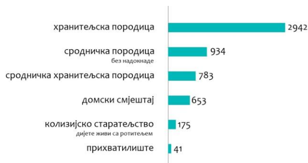
Графикон бр.2: Број дјеце под сталном старатељском заштитом [5]

Дјеца издвојена из породице зависно од случаја одлазе у хранитељске или сродничке породице, проналазе своје мјесто у дому или прихvatној станици. Графикон бр.2 показује број дјеце под старатељством према врсти смјештаја.