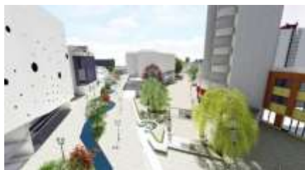
Sl.3. Uređenje centra

Tabelarni pregled površina, projektovano stanje: Izgrađena površina 35 %: Neizgrađena površina 65% (nepropusni zastori 41%, propusni zastori 18% i pod biljnim pokrovom 6% - bez površine reke Raške).