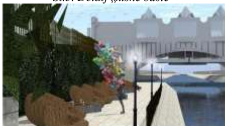
Sl.6. Uređenje rečnog korita sa mobilijarom

Reka predstavlja i simboliku protoka vremena, ona ne umire kao i vreme koje ne staje, kao i istorija koja gradi i razgrađuje civilizacije i gradove.