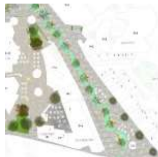
Sl.2. Vraćanje potoka u Čaršiju (izvod iz projekta)

Cilj rada jeste vraćanje živih vodenih tokova na površinu sa uređenjem vodenih korita i obala, kao ključnog urbanog motiva u pejzažnom uređenju gradskog terena. Tehnička realizacija ove zamisli uticala bi na vraćanje svesti kod ljudi o vrednostima koje voda nudi, o potrebi njenog očuvanja i većoj težnji da ona svojim pokretom, zvukom, bojom, evaporacijom, mirisom, florom i faunom postane okosnica čaršije i zapis tla iz prošlosti.