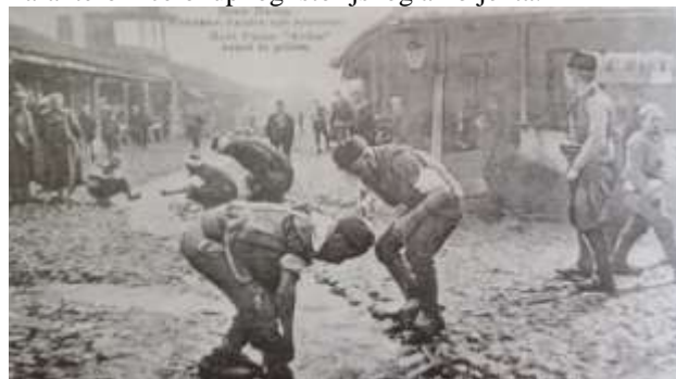
Sl.1. Potok u staroj čaršiji (arhivski snimak)

Uprkos objektima visokih spomeničkih vrednosti, kao što su Hamam Isa-bega Ishakovića, Hasan Čelebijina džamija sa trgovačkim objektima i drugi, na prostoru starog jezgra i u neposrednoj okolini, izgrađeni su objekti većih gabarita i volumena prema arhitektonskim obrascima koji su u neskladu sa estetskim merilima ili urbanim karakterom celokupnog istorijskog ambijenta.