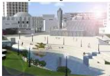
Sl.7. Uređenje rečnog korita

U grafičkim priložima razrađeno je jedno sa spuštanjem trga ka reci i uređenjem rečnog korita.