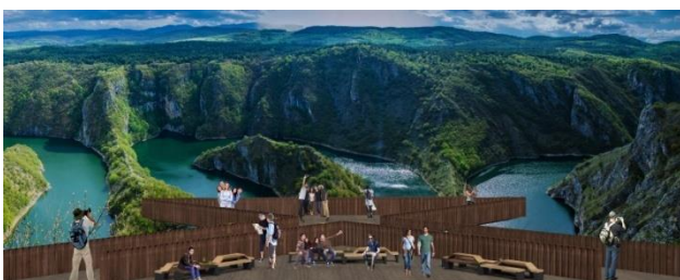
Slika 3: Novoprojektovani vidikovac br.3