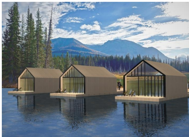
Slika 5: Vizuelni prikaz smeštajnih kapaciteta na vodi

Sa obzirom na to, odlučila sam da takav potencijal iskoristim za razvoj jednog turističkog vikend naselja koje bi bilo namenjeno za boravak sportista. Kuće u okviru ovog vikend naselja osmišljene su kao individualne kuće koje su projektovane po uzoru na tradicionalnu Sjeničku kuću. Ovo vikend naselje nalazi se u blizini Sjeničkog jezera, u predivnom i mirnom okruženju.