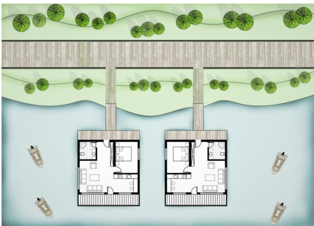
Slika 4: Parterno rešenje smeštajnih kapaciteta na vodi

Sjenica nudi mnoge pogodnosti za rekreaciju i sport, pa shodno tome mnoge sportske ekipe iz naše zemlje i inostranstva koriste ove klimatske pogodnosti za letnje i zimske pripreme sportista u mnogim disciplinama.