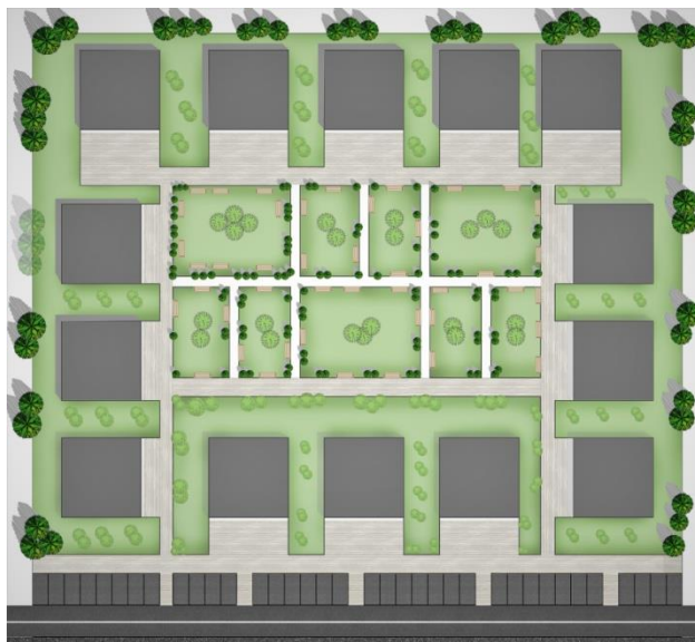
Slika 6: Urbanističko rešenje vikend naselja za sportiste

U okviru naselja planirano je i mesto za okupljanje sportista zamišljeno kao manja parkovska celina sa ambijentalnim vrednostima.