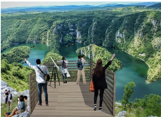
Slika 2: Novoprojektovani vidikovac br.2