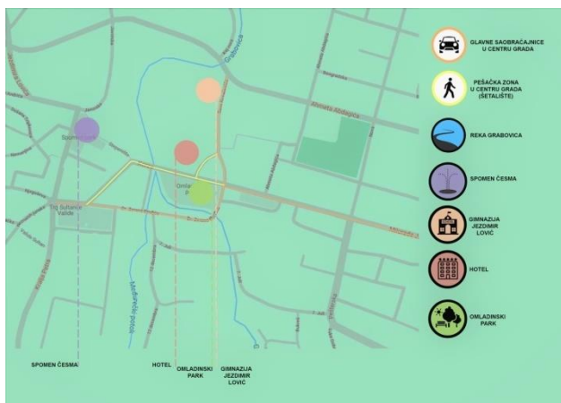
Slika 7: Povezanost centra grada sa novoprojektovanim hotelom

Planirani sadržaj treba da postane značajan generator aktivnosti lokalnih korisnika i gostiju iz regiona, i na taj način podigne atraktivnosti šireg prostora u kome se nalazi.