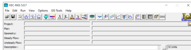
Slika 3 – Osnovni prozor HEC-RAS softvera

Na slici 3 je prikazan osnovni prozor HEC-RAS softvera sa svim komandama.