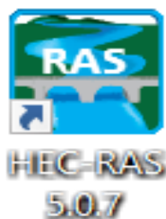
Slika 2 – HEC-RAS ikona na desktopu

Za ovaj rad primenjen je programski paket HEC-RAS verzija 5.0.7., slika 2.