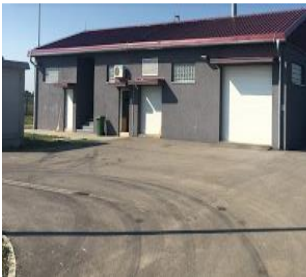
Slika 1. Postrojenje za prečišćavanje otpadnih voda u naselju Kovilj

Postrojenje za prečišćavanje otpadnih voda u naselju Kovilj prikazano na Sl. 1 je izgrađeno iz dve etape tako da je druga etapa obuhvatala samo nadogradnju postojećeg postrojenja izgradnjom drugog SBR reaktora za 3250 stanovnika [4]. Kada je postrojenje pušteno u rad upotrebljavao se samo SBR1 bazen, dok je SBR2 služio kao rezervni, u slučaju da dotekla voda premaši kapacitet SBR1 bazena.