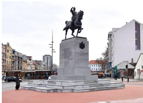
Slika 1. Centar Novog Sada, Trg republike

omogućava zadata lokacija. Ovaj deo grada izabran je zbog konstantno visokog stepena koncentracije ljudi. Time će stalan pristup biti omogućen, kako stanovnicima Novog Sada, tako i turistima.